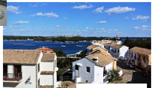
志摩地中海村全景