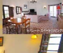
セバレートスイート(リビング)

◆メゾネット・スイート 1フロアはベッドルームとバスルーム、もう1フロアがリビングになっていて時間帯や目的によって部屋を使い分けます。