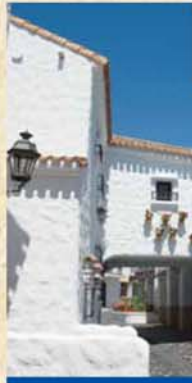
アンダルシアの街

情熱の国スペインを象徴する街並みを持つスペイン南部の地中海に面したアンダルシア地方をイメージ化したアンダルシアゾーン。建築様式は、ロンダ、カサレスの街並みを参考にしています。明るい葎やいだ海辺の都市の雰囲気を描いています。