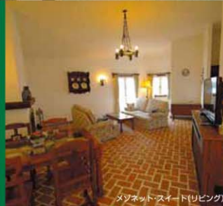
メゾネットスイート(リビング)

◆セバレート・スイート 2階建てではなく、1フロア120㎡のスイートタイプのお部屋です。1フロアにベッドルーム、バスルーム、リビングが独立しています。