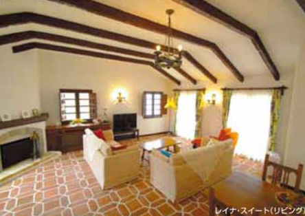
レイナ・スイート(リビング)

志摩地中海村の真髄は、広大な敷地に点在するヴィラスタイルのお部屋。そのすべてが素晴らしいロケーションとそれぞれに間取りやしつら元の異なるスイートルーム。他にはないホスピタリティーで皆様をお迎え致します。英虞湾の青い空や海、森に優しく溶け込む赤瓦と白亜の壁は、ゲートをくぐった瞬間、あなたを楽園の指定席へと誘います。