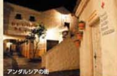
アンダルシアの街

英虞湾の作り出す豊かな自然環境の下に広がる「志摩地中海村」は30,000㎡の広い敷地内にご宿泊はもちろんレストラン、カフェ、ショップ、クラフト工房、クルージングなど体験&滞在型リゾートがお楽しみ頂けます。