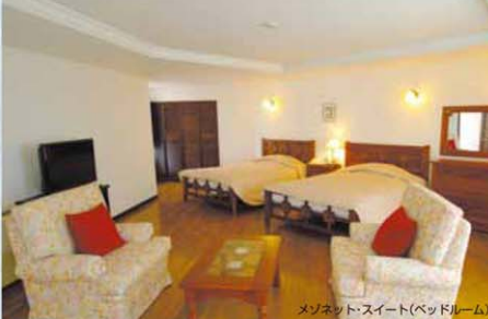
メゾネットスイート(ベッドルーム)

◆ツインルーム 地中海風のかわいい家具を揃えました。約30㎡の広さのお部屋で、ベッドはダブルサイズを2台常設。バスルームはユニットバスとなります。