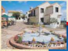
プラザマジョール(噴水広場)