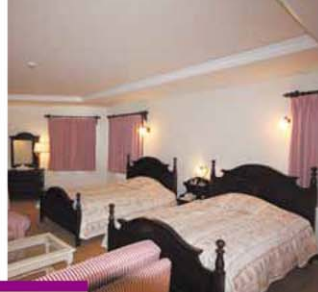
セバレートスイート(ベッドルーム)

志摩地中海村の真髄は、広大な敷地に点在するヴィラスタイルのお部屋。そのすべてが素晴らしいロケーションとそれぞれに間取りやしつら元の異なるスイートルーム。他にはないホスピタリティーで皆様をお迎え致します。英虞湾の青い空や海、森に優しく溶け込む赤瓦と白亜の壁は、ゲートをくぐった瞬間、あなたを楽園の指定席へと誘います。