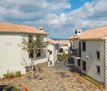
カスティールヤの街