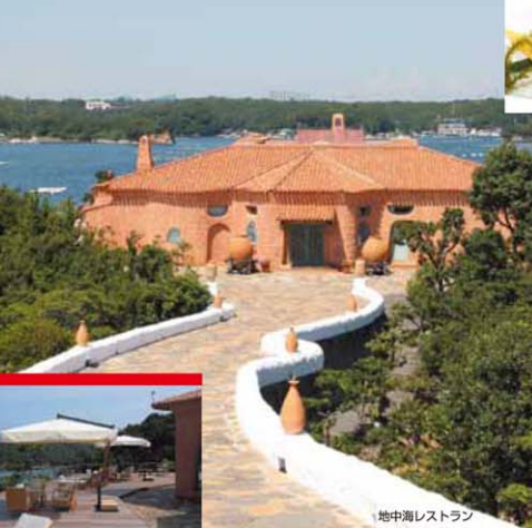
地中海レストラン

◆地中海料理 リアス式海岸で有名な伊勢志摩は、海の幸の宝庫です。その新鮮な素材を使った地中海料理をコース仕立てでご用意しております。