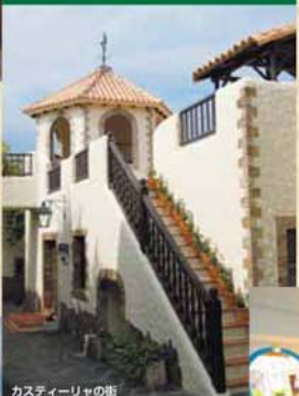
カスティールヤの街

マドリードの南に広がるスペイン中部に位置するカスティールヤ地方。乾いた大地がどこまでも続く高原をイメージ化したゾーン。建築様式はトレード・ロマンチャ地方を参考にしています。素朴な石積みの窓を持つ建蔵など、全体に山岳的な雰囲気を描いています。