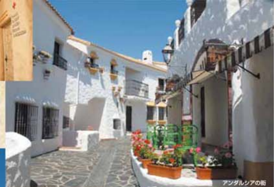
アンダルシアの街